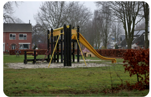
(Speeltuin Nieuwbouw Alteveer)

Een goed onderhouden dorp draagt bij aan een prettige leefomgeving. Daarom wordt het onderhoud van groenvoorzieningen en speeltuinen verbeterd. Ook wordt gekeken naar de aanleg van een park en de aanplant van bomen op lege plekken in de wijk, wat tevens een alternatief kan bieden voor de huidige hondenuitlaatplekken.