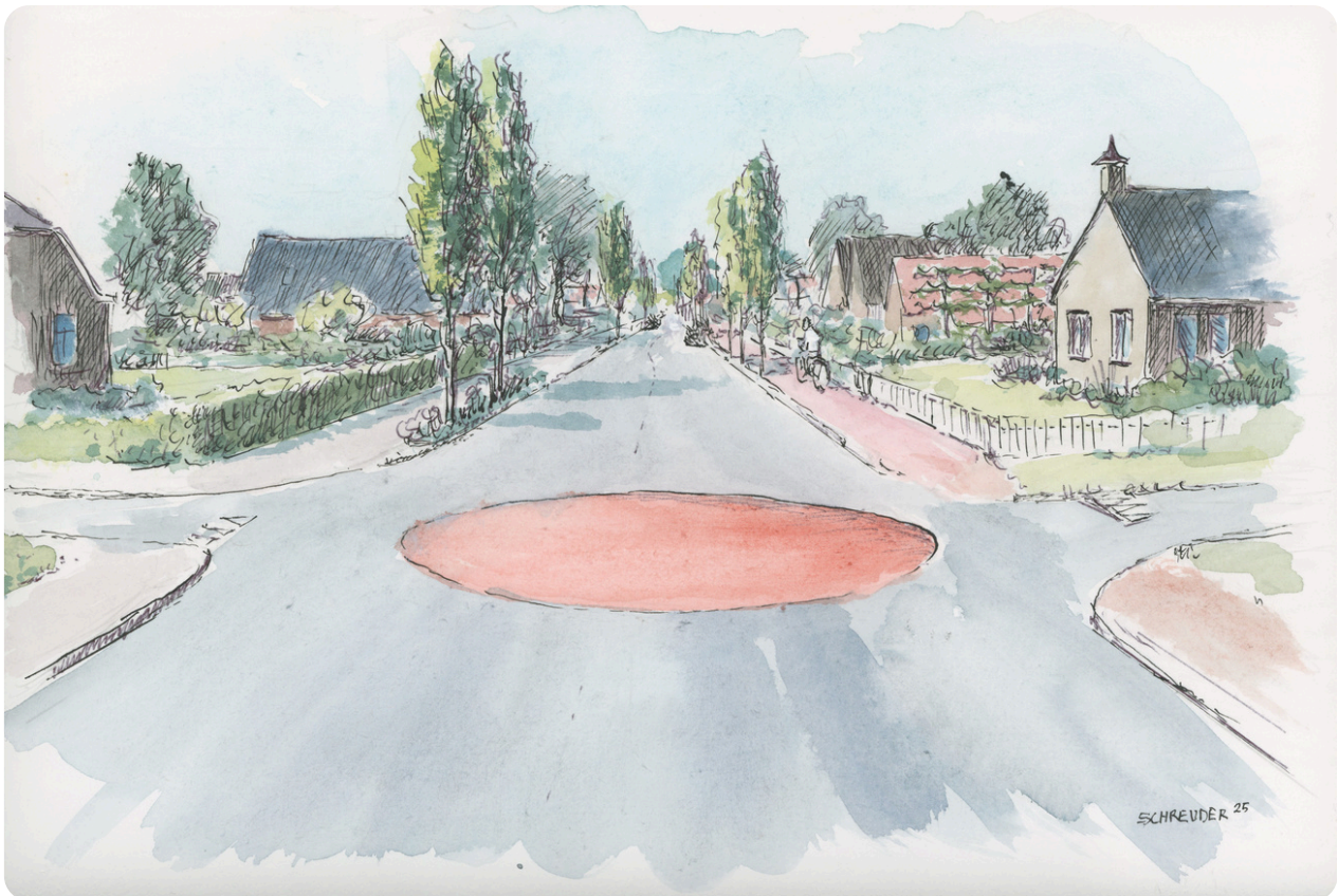
(De Beumesweg van de toekomst, door Geert Schreuder)