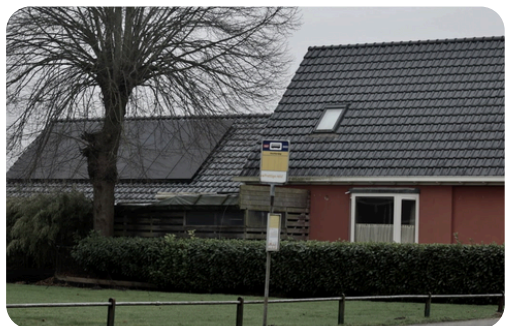
(Bushalte langs de Beumesweg)

Om het openbaar vervoer aantrekkelijker te maken, wordt ingezet op het verbeteren van de busverbinding tussen Alteveer en Veendam. Dit zorgt ervoor dat inwoners makkelijker en sneller toegang hebben tot voorzieningen en werkgelegenheid buiten het dorp.