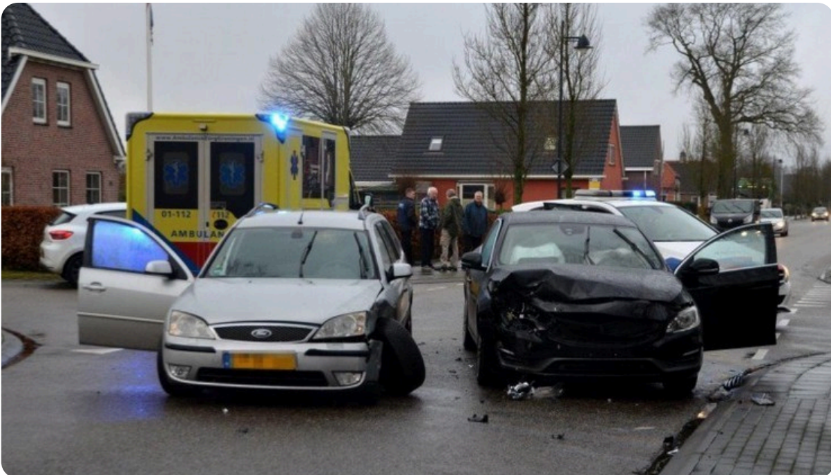
(Ongeval kruispunt Beumesweg - Tangerveldweg)

Het verhogen van het attentieniveau van bestuurders op de zijwegen in Alteveer staat al op de kaart bij de gemeente (mede door de ongelukken), en met het aanpakken van de zijwegen/kruispunten kan verhoudingsgewijs eenvoudig een effectieve ingreep gedaan worden v.w.b. verkeersveiligheid.