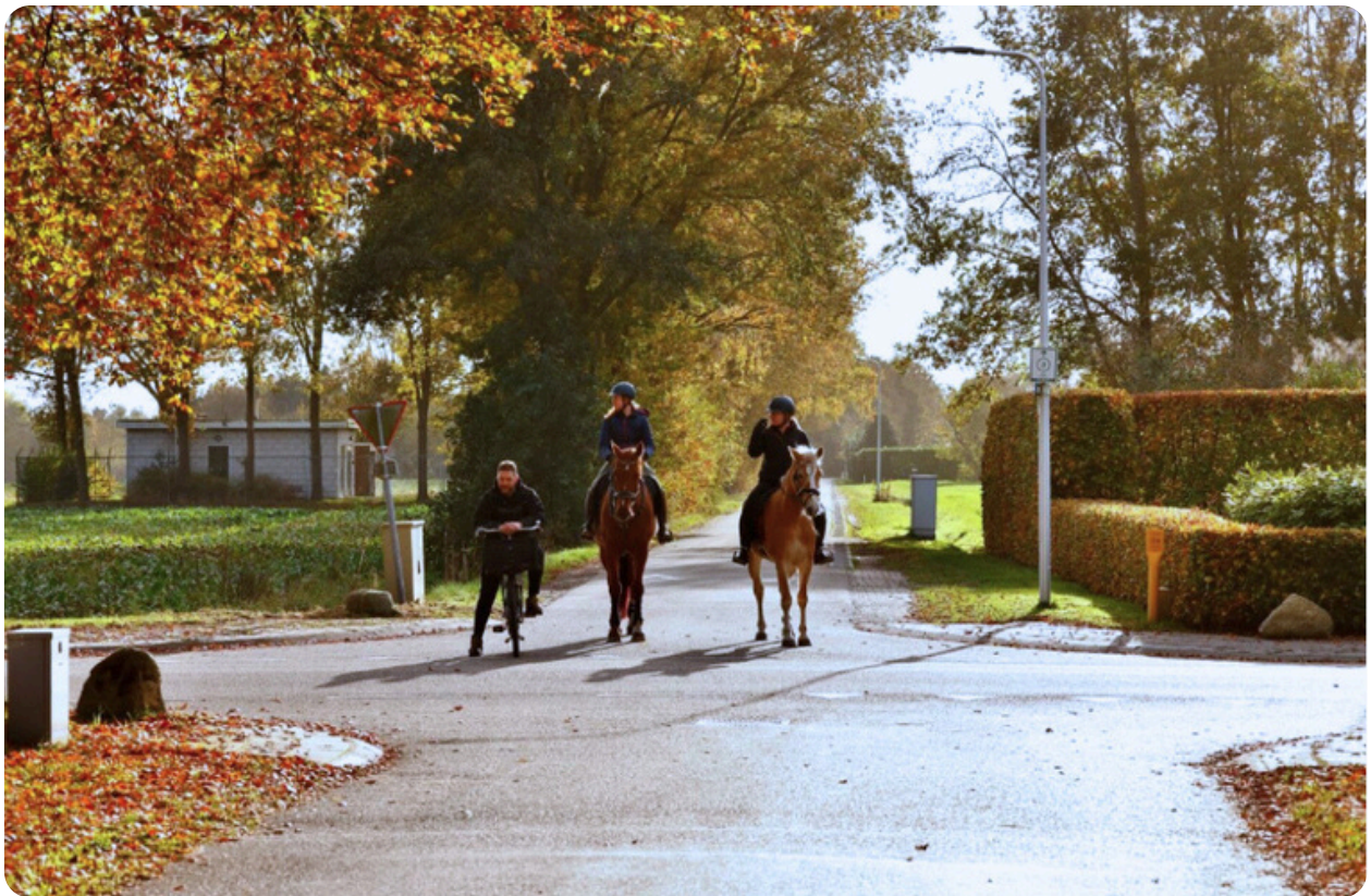
(Kwetsbare verkeersdeelnemers wachten op een kans om de Beumesweg over te steken)