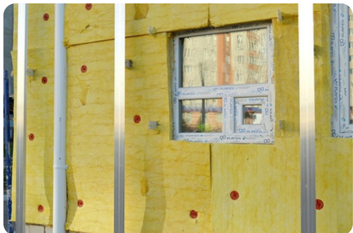
(Isolatie in een woning)