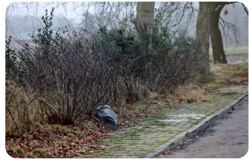
(Afval langs de weg)

Om hondenpoepoverlast tegen te gaan, zullen er prullenbakken en dispensers met zakjes worden geplaatst. Daarnaast wordt ingezet op het verminderen van zwerfvuil door extra prullenbakken in de wijk. Verder wordt gekeken naar de mogelijkheid om meerdere hondenuitlaatplaatsen in het veld te creëren.