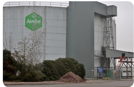
(Silo van AVEBE)

De silo van AVEBE biedt mogelijkheden als cultureel centrum of ontmoetingsplek voor bewoners. Een van de dorpsvisieleden onderzoekt momenteel hoe deze silo ingezet kan worden. Een idee is om de buitenkant te beschilderen met een Gronings landschap, wat het dorp een unieke uitstraling zou geven. Daarnaast wordt er overwogen een supermarkt of café te openen in de nabije omgeving om de sociale interactie te bevorderen.