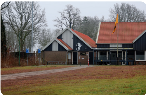
(Voetbalvereniging V.V. Alteveer)

De Drijscheer en het voetbalveld moeten aantrekkelijker worden voor de inwoners. De voetbalvereniging heeft aangegeven zich graag aan te sluiten bij de MFA, wat zou betekenen dat de gymzaal, kantine en ruime parkeerplaats gezamenlijk benut kunnen worden. Er is binnen de vereniging draagvlak voor deze samenwerking.