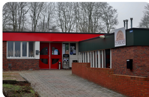
(Dorpshuis De Drijscheer)