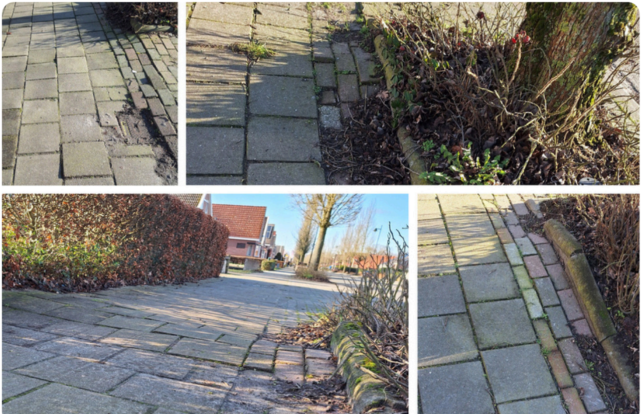
(Door boomwortels omhooggedrukte stoeptegels aan de Beumeesweg)

Een bijkomend voordeel is esthetisch: deze prunussen bloeien prachtig in het voorjaar!