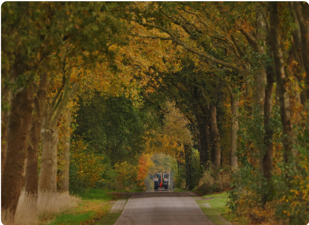
(De Tangerveldweg op een mooie herfstdag)

Met deze concrete stappen werken we gezamenlijk aan een toekomstbestendig Alteveer, waarin leefbaarheid, veiligheid en sociale samenhang centraal staan.