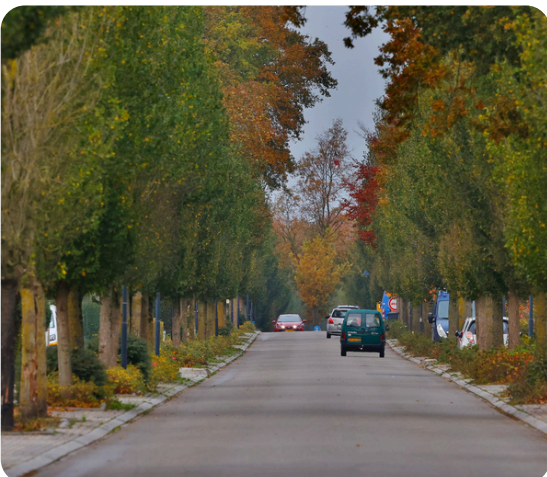
(De Beumesweg op een stille zaterdagochtend in november 2024)